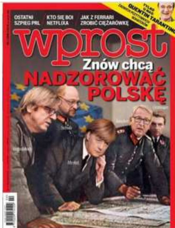
„Wprost”, 10.01.2016 /11- 17.01.2016

Verschwörung gegen Polen. Von Targowica bis KOD von Zarin Katharina bis Merkel