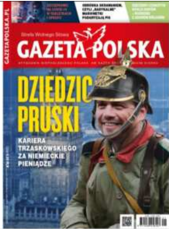
„Gazeta Polska“, 26.05.2021