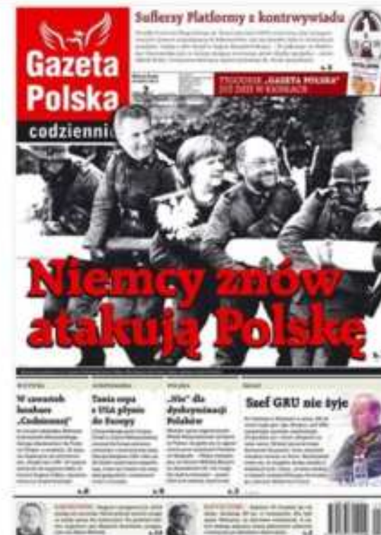
„Gazeta Polska Codzienna” 4.01.2016

Sie wollen Polen erneut/wieder überwachen/kontrollieren