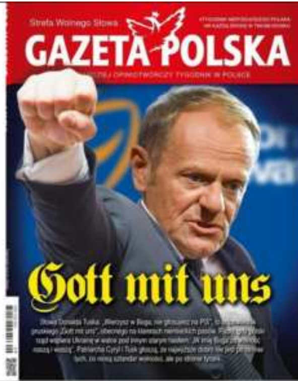
„Gazeta Polska“, 20.07.2022