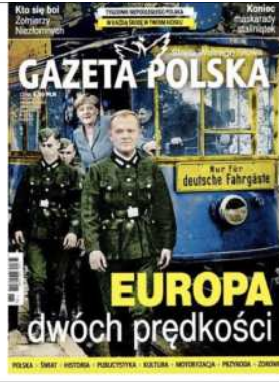
„Gazeta Polska“, 15.03.2017